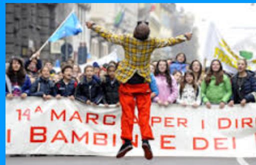
Uniti per i bambini